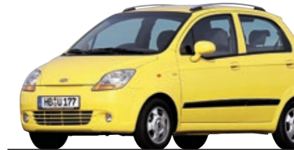
10- UND 11-JÄHRIGE

Klapprige Achsaufhängung, rostiger Auspuff, viel zu viel Ölverlust - und immer wieder rasselt er durch die Abgasuntersuchung: Auf den Chevy Matiz ist Verlass, er war schon vergangenes Jahr Letzter nach der vierten HU.