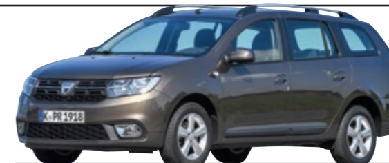
2- UND 3-JÄHRIGE

Einfache Regel beim TÜV-Report: Grün ist gut, Rot ist schlecht