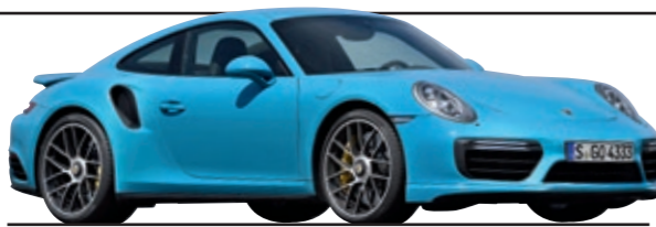
6- UND 7-JÄHRIGE

Na klar, der Elfer! Note 1 bei der zweiten HU. Aber da hat so ein Elfer auch erst 40 000 km runter, der Schnitt hat 73 000.