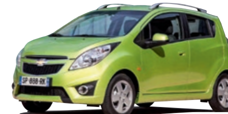
6- UND 7-JÄHRIGE

Bremsleitungen und -schläuche sind okay, vieles andere nicht. Da wären: Achsfedern, Ölverlust, Bremsprobleme. So wird man Letzter.