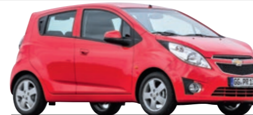
8- UND 9-JÄHRIGE

Eins muss man dem Spark ja lassen: Er rostet nicht an der Karosserie. Das war's aber auch. Gammelauspuff, Ölverlust, labile Achsen - beim dritten TÜV ist keiner schlechter.