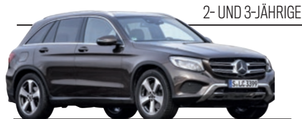
2- UND 3-JÄHRIGE

Porsche und Mercedes olé, Chevrolet und Dacia oje! So lässt sich der TÜV-Report auch zusammenfassen. Wenn Sie genau wissen wollen, wie Ihr Auto beim TÜV ist , sollten Sie diese Tabellen lesen. PS: Rot ist doof!