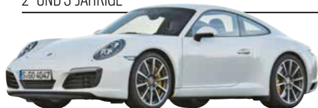
PORSCHE 911 (Typ 991)

Erster TÜV-Termin für den Elfer: Es ist ein Kindergeburtstag. Kein Wunder, wer 100 000 Euro und mehr zahlt, der pflegt.