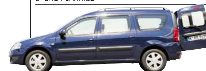
DACIA LOGAN (1. Generation)

Rostige Auspuffanlagen, Ölverlust, miese Werte bei der AU, dazu verschlissene Fahrwerkskomponenten wie Lenkgelenke – fertig ist die TÜV-Blamage.