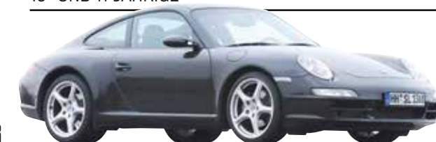
PORSCHE 911 (Typ 997)

Ja, Ölverlust ist ein Thema beim fünften TÜV-Termin. Ja, auch Lenkgelenke nutzen sich ab. Aber für einen Elfjährigen ist der Elfer top.