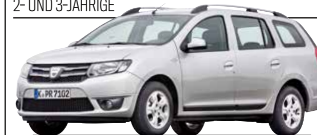
DACIA LOGAN (2. Generation)

Bremsfunktion? Okay. Aber Ölverlust, riefige Bremsscheiben, Abgasuntersuchung und Beleuchtung vermiesen ihm die TÜV-Bilanz.