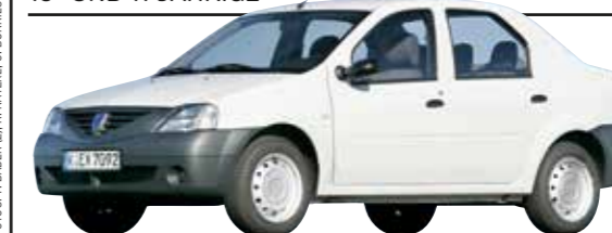
DACIA LOGAN (1. Generation)

Rost – und der nicht nur am Auspuff, ganz miese Beleuchtungs-Werte und labile Lenkgelenke. Ja, der Logan ist billig. Aber nicht haltbar.