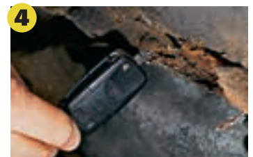
4 Korrosion Bei einigen Autos immer ein Thema. Sind tragende Teile betroffen, gibt es keine neue Plakette