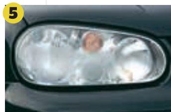
5 Beleuchtung Neben undichten Scheinwerfergehäusen kommen oft defekte Leuchtweitenregler vor