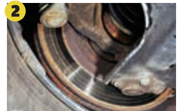
2 Bremsscheiben Tiefe Riefen, Risse und zu geringe Materialstärke verhindern eine erfolgreiche Prüfung