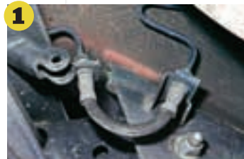
1 Bremsschläuche Im Alter werden sie porös oder quellen nach innen auf. Der Austausch ist nötig

Mängelgruppe wie beispielsweise Korrosion oder Bremsleitungen. Rechts daneben Fahrzeugalter. Noch eine Splate weiter rechts die Durchschnittsquote der Mängel. Im Vorjahresvergleich sind Ölverluste bei elfjährigen Prüflingen mit 9,8 Prozent (2014: 10,2%) leicht rückläufig, 2,9 Prozent aller Siebenjährigen haben verschlissene Bremscheiben. 0,7 Prozent der Fünfjährigen wurden mit zu viel Lenkspiel auffällig. Beide Durchschnittswerte bewegen sich auf dem Mangelniveau von 2014.