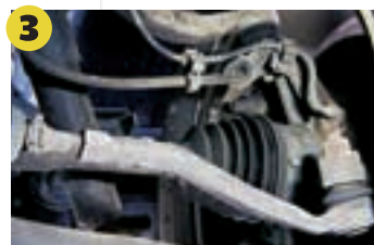
3 Fahrwerk Bei erheblichem Spiel in den Achsgelenken ist keine sichere Radführung mehr gewährleistet